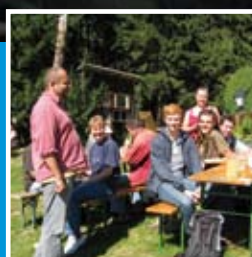
Willkommen im Of(f)'n-Stüberl