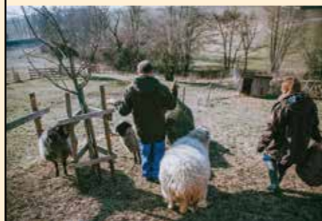
Menschen mit Behinderungen

Weitere Beschäftigungen in der Werkstätte umfassen zum Beispiel das Aufwickeln von Gurten, das Herstellen von Grillanzündern oder das Stricken von Hauben an der Strickmaschine. Außerdem sammeln die Bewohner:innen Kräuter und Blüten, aus denen Sirupe, Salze und Blütenzucker hergestellt werden.