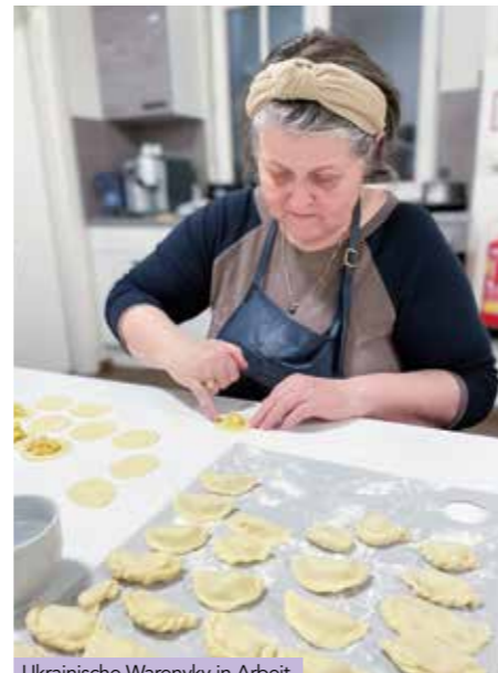
Ukrainische Warentyky in Arbeit