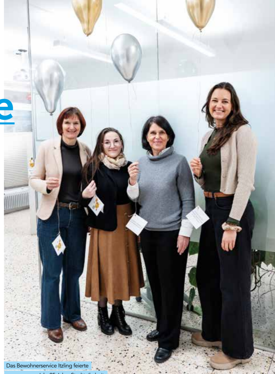
Das Bewohnerservice Itzling feierte vergangenes Jahr 25 Jahre Stadtteilarbeit.

S tadtteilarbeit setzt dort an, wo gesellschaftliches Zusammenleben konkret wird: im unmittelbaren Wohnumfeld, in Nachbarschaften, auf Plätzen und in Häusern. Sie versteht den Stadtteil als lebendigen Raum, in dem Menschen mit unterschiedlichen Lebensrealitäten aufeinandertreffen und ihr Zusammenleben aktiv gestalten. Ziel ist es, Teilhabe zu ermöglichen, Beziehungen zu stärken und gemeinsam Lösungen für lokale Herausforderungen zu entwickeln.