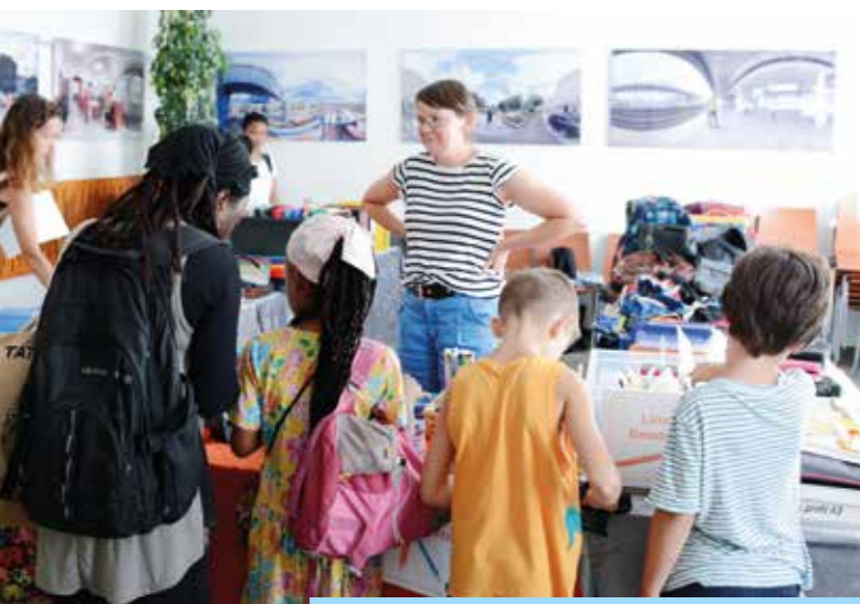
Bei der Schulsachen-Tauschbörse der GB* in Wien profitierten rund 150 Familien von den gut erhaltenen gespendeten Schulsachen, die an zwei Tagen kostenlos ausgegeben wurden.

Stadtteile leben von Begegnung, Beteiligung und gegenseitiger Unterstützung. Stadtteilarbeit schafft dafür die notwendigen Rahmenbedingungen: Sie bringt Menschen zusammen, greift Anliegen auf und stärkt das soziale Miteinander dort, wo Alltag stattfindet – direkt im Wohnumfeld.