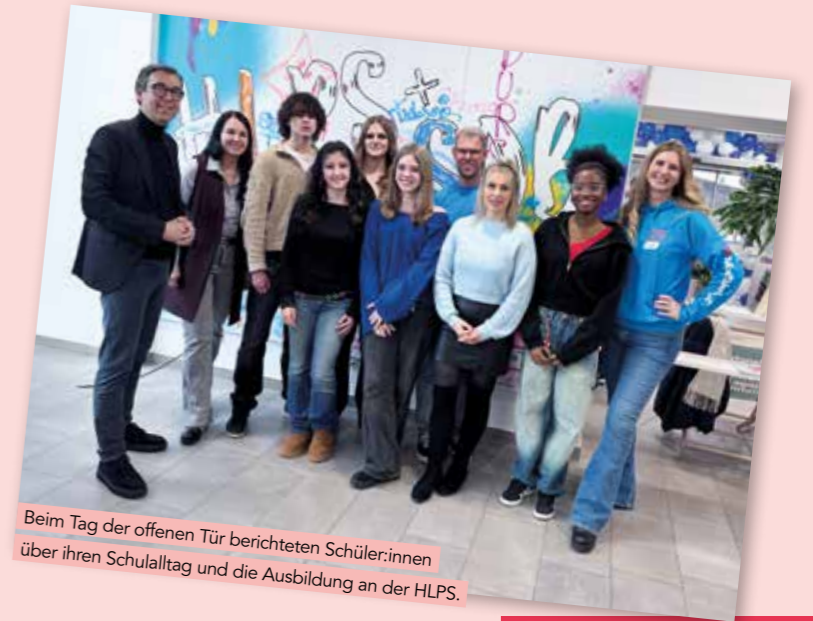
Beim Tag der offenen Tür berichteten Schüler:innen über ihren Schulalltag und die Ausbildung an der HLPS.

Zu ihren Lieblingsfächern zählen Praxis und Kommunikation. „Vor allem die Kombination aus Theorie und direkter Anwendung ist etwas Besonderes.“ Auch Psychohygiene und Supervision (PHSV) sind fixer Bestandteil des Unterrichts. „In PHSV lernen wir, wie man über die Erfahrungen im Arbeitsalltag spricht. Man übt auch den Umgang mit Problemen und lernt, auf sich selbst aufzupassen, damit man nicht gestresst wird.“ Themen, die im späteren Berufsleben eine große Rolle spielen – und schon in der Schule Platz haben.