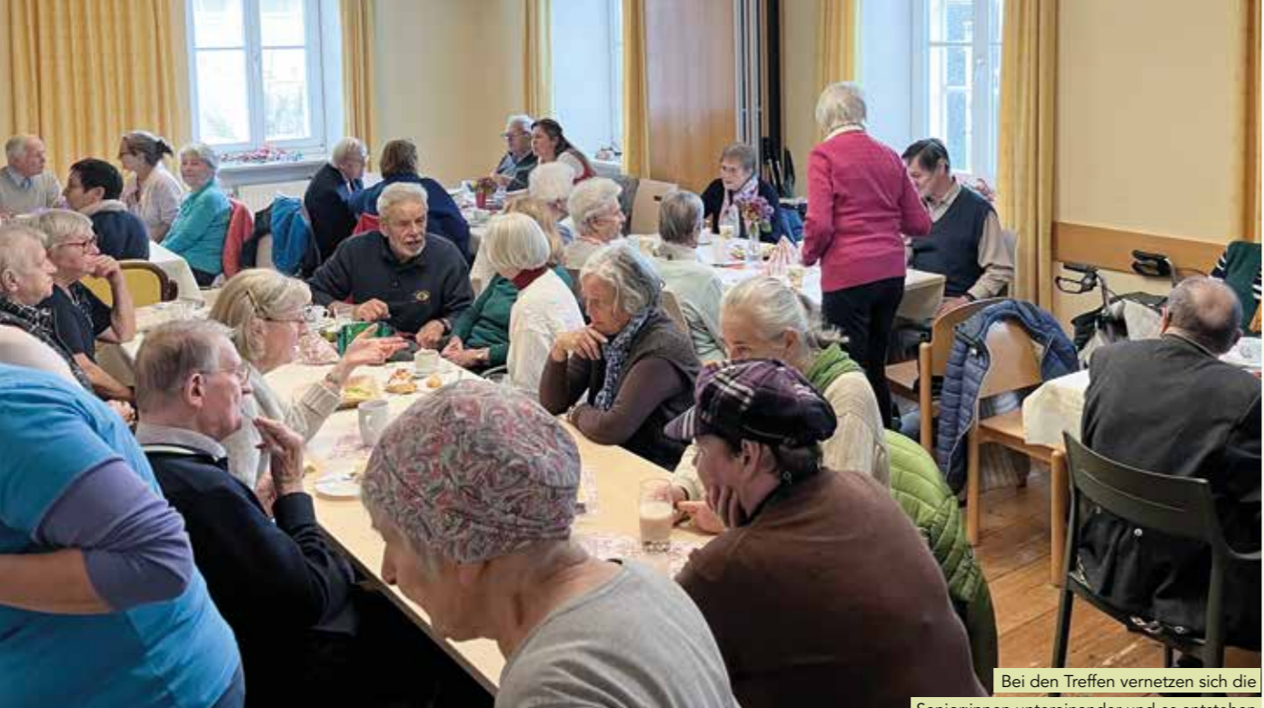
Bei den Treffen vernetzen sich die Senior:innen untereinander und es entstehen verschiedenste Ideen und Aktivitäten.