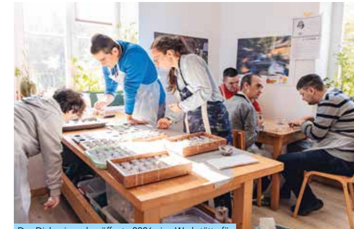
Das Diakoniewerk eröffnete 2006 eine Werkstätte für Menschen mit Behinderungen in Sibiu.

Das Engagement des Diakoniewerks über Landesgrenzen hinweg folgt einem klaren Verständnis von diakonischem Handeln: Unterstützung dort zu