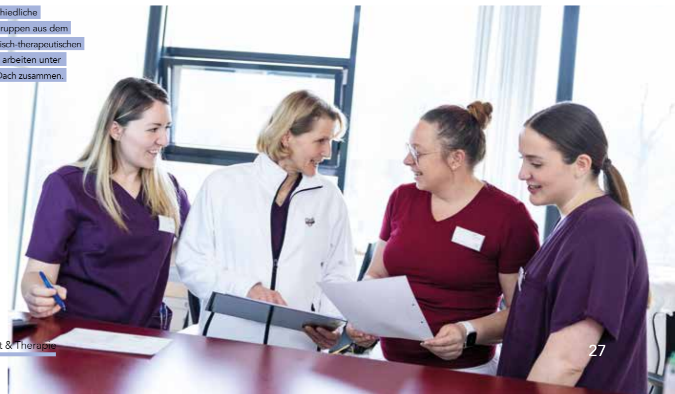
Unterschiedliche Berufsgruppen aus dem medizinisch-therapeutischen Bereich arbeiten unter einem Dach zusammen.

Mit dem weiteren Ausbau der PVEs setzt das Diakoniewerk ein klares Zeichen: für wohnortnahe Gesundheitsversorgung, für Zusammenarbeit und für ein System, das den Menschen in den Mittelpunkt stellt. Dort, wo Gesundheit beginnt.