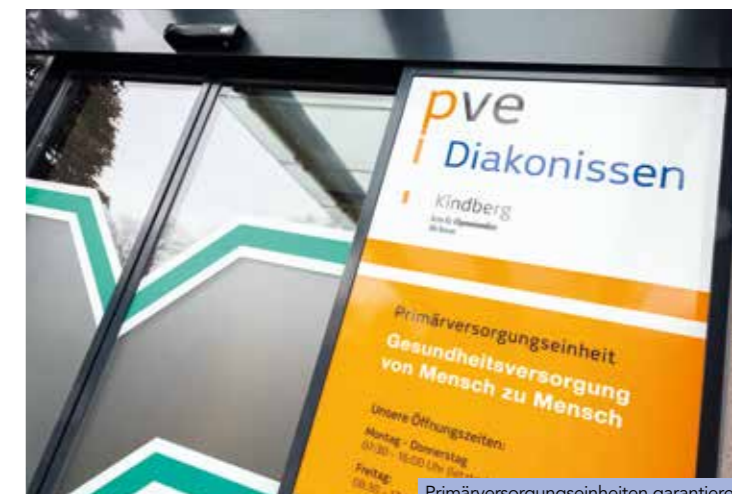
Primärversorgungseinheiten garantieren langfristig eine wohnortnahe medizinische Versorgung.