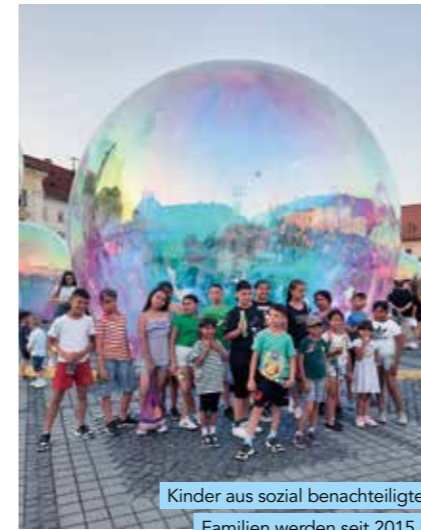
Kinder aus sozial benachteiligten Familien werden seit 2015 in den Tageszentren in Dumbraveni und Sebeş begleitet.