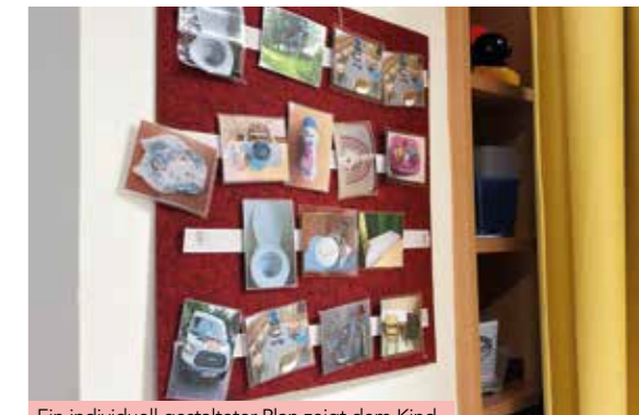
Ein individuell gestalteter Plan zeigt dem Kind, was kommt – das reduziert Stress und gibt Sicherheit.

Der Kindergarten Mühle zeigt, wie komplexe pädagogische Arbeit gelingen kann, wenn Haltung, Fachwissen und Rahmenbedingungen zusammenspielen. Ermöglicht wird diese Qualität auch durch die gute Unterstützung des Diakoniewerks und der Bildungsdirektion Oberösterreich – sei es durch ausreichend Personal, Fortbildungen oder räumliche Entwicklungen. Diese Zusammenarbeit schafft die Basis dafür, dass Kinder im Autismus-Spektrum im Bildungsalltag nicht nur betreut, sondern verstanden und begleitet werden.