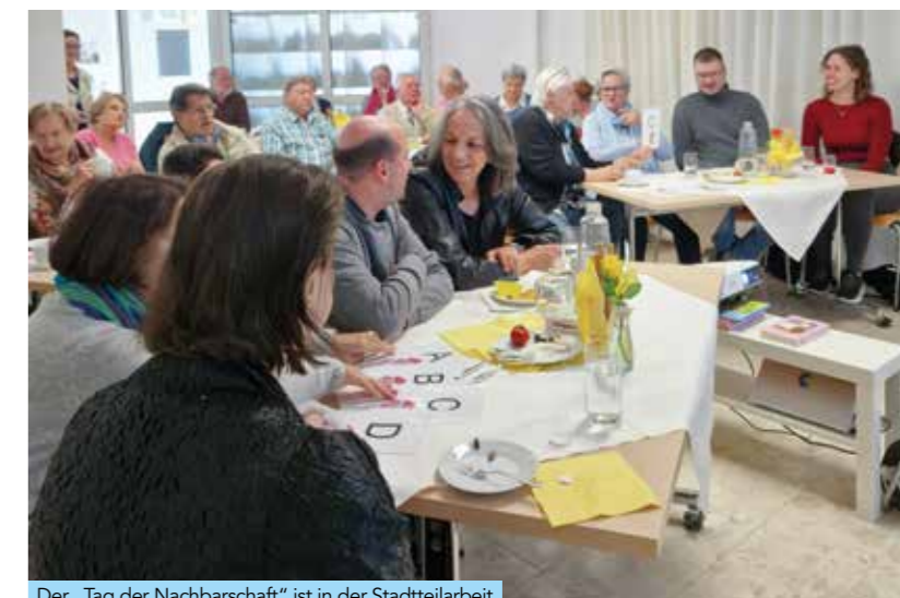
Der „Tag der Nachbarschaft“ ist in der Stadtteilarbeit Salzburg jedes Jahr Anlass für Feste und Veranstaltungen.

Verbunden sein Quartiers- und Stadtteilarbeit