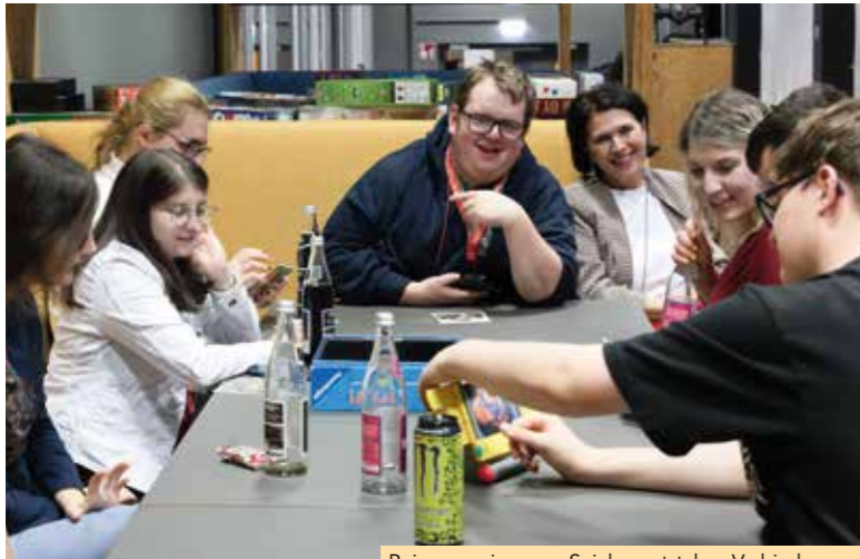
Beim gemeinsamen Spielen entstehen Verbindungen.

Donnerstagabend im „last by Schachermayer“ in Linz. Skateboards rollen über den Beton, junge Menschen sitzen am Boden, andere stehen an der Bar, spielen Karten oder greifen zum Controller. Zwischen Pizza, Getränkekühlschrank und Tischtennisplatte entsteht alle drei Wochen ein besonderer Raum: der FRISBI-Stammtisch.