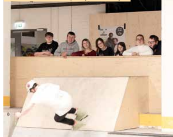
Menschen mit Behinderungen