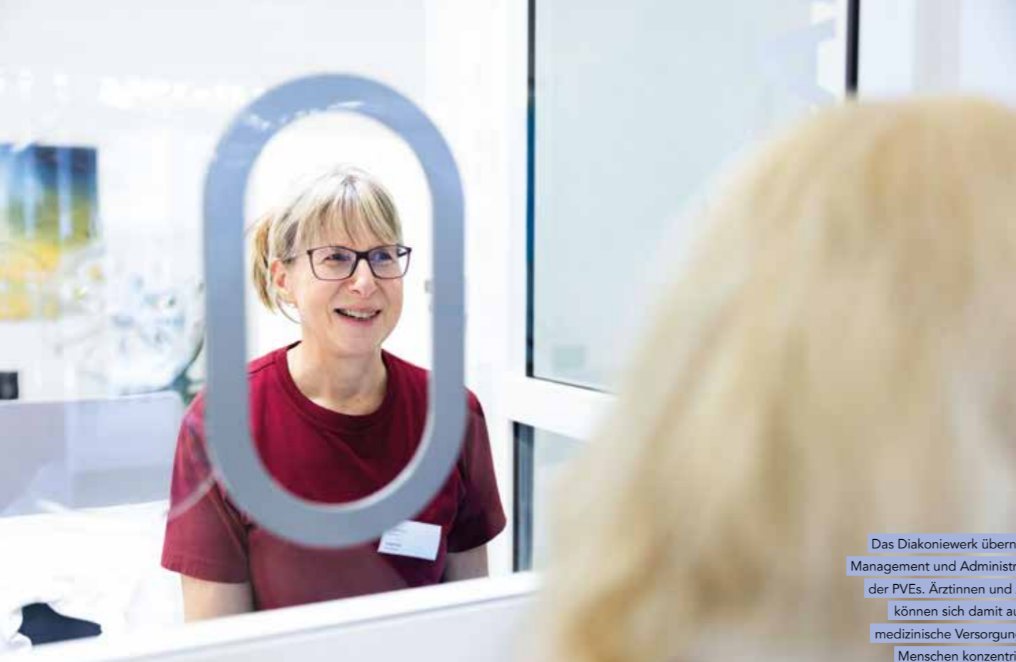
Das Diakoniewerk übernimmt Management und Administration der PVEs. Ärztinnen und Ärzte können sich damit auf die medizinische Versorgung der Menschen konzentrieren.